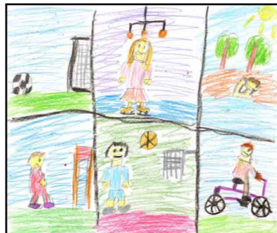
Кира Липецкая (10 лет)