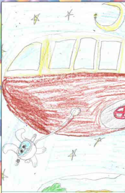
София Матвеева (8 лет)